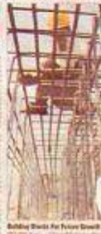
Building Blocks for Future Growth

Engineers to offer online consultancy for construction clients