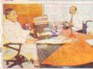
NEW DELHI Thursday | April 12 | 2006